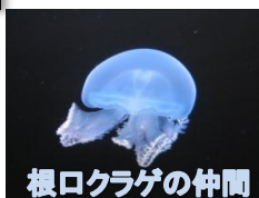
根口クラゲの仲間